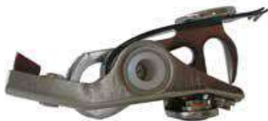
24.3019 impianto Piaggio