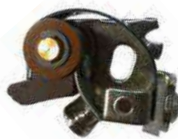
24.3020 impianto Piaggio