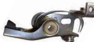
24.3022 impianto Piaggio - doppia molla

Rif. Piaggio: 097477 (87247 • 42157/16418)