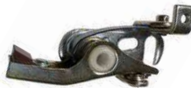
24.3021 impianto Piaggio

Rif. Piaggio: 097478 (87248 • 16416/16418)