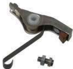
01.0610 impianto Piaggio - adattabile