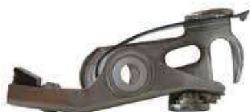
24.3018 impianto Piaggio