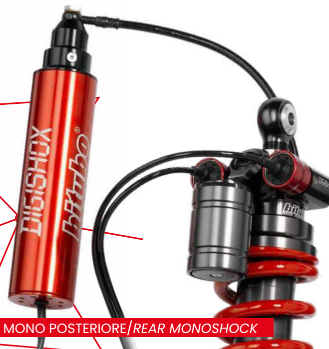
MONO POSTERIORE/REAR MONOSHOCK