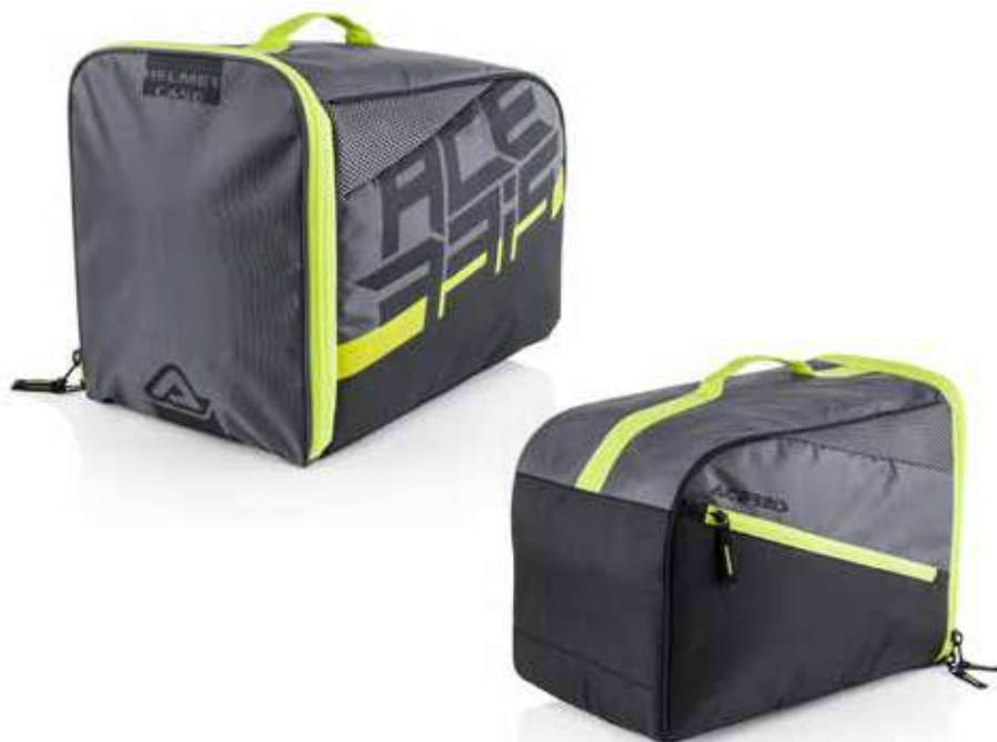
0023262.318 BLACK/FLUO YELLOW