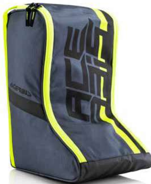
0023865.318 BLACK/FLUO YELLOW