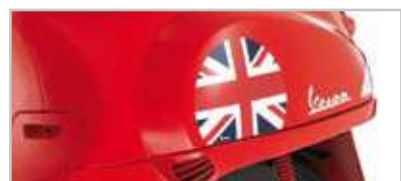
605138M004 "Bandiera" UK- "Flag" UK