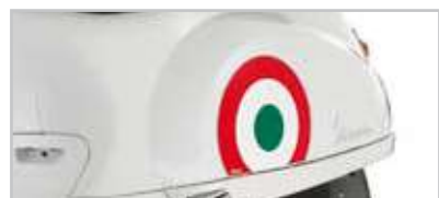
605138M003 "Bandiera" Italia- "Flag" Italy