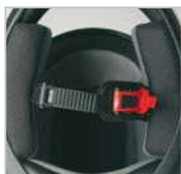
Sistema di chiusura micrometrico Micrometric adjustment