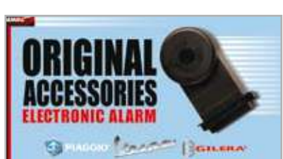
602689M Allarme elettronico E-1. Vedi pag. 45. Electronic alarm E-1. See page 45.