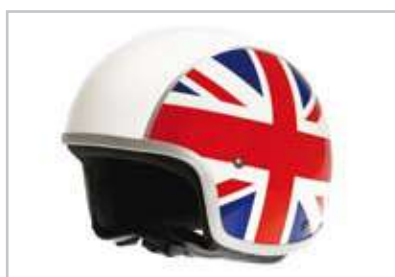
Casco Vespa "Europa" 605139M0XX Casco demi-jet. Fondo bianco con grafica "bandiere Europa" (Italia, UK, Francia, Spagna). Vedi pag. 39. Demi-jet helmet "Europe" Vespa. White shell with "Flag" graphics (Italy, UK, France, Spain). See page 39.