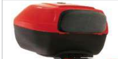
605054M NERO MASTERIZZATO BLACK UNPAINTED