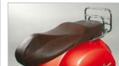
GT - 602934M0BR GTS - 602935M0BR Sella in vera pelle di alta qualità realizzata artigianalmente con trattamento specifico protettivo. Colore tabacco con cuciture oro. Made in Italy. High-quality handmade genuine leather saddle, specially treated with natural wax. Tobacco coloured with gold stitching. Made in Italy.