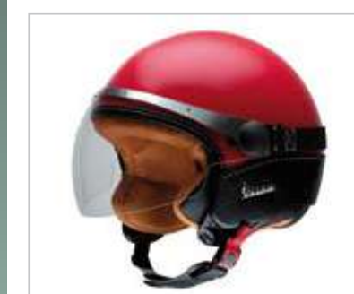
605099M0XX Vespa "Granturismo". Vedi pag. 39. Vespa "Granturismo". See page 39.