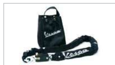
602942M Antifurto meccanico a catena con maglia semiquadra spessore 8 mm e lucchetto, altissima tenacità. Lunghezza 120 cm. Guaina e borsa personalizzate con logo Vespa color argento. Heavy duty square 8 mm link security chain with padlock. Length: 120 cm. Chain sheath and holder with customised silver Vespa logo.