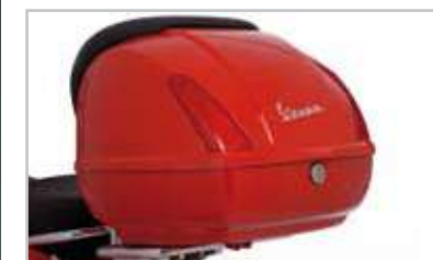
GT - 621380M0XX GTS - 623698M0XX Bauetto 42 litri, poggiaschiena incluso, rivestito in tessuto sella, logo Vespa cromato. 42-litre top case, comes with backrest padded in co-ordinated saddle material. Chrome-plated Vespa logo.