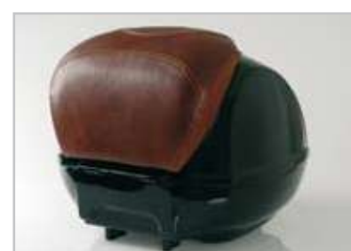
GT/GTS -602938M0BR Poggiaschiena in vera pelle in abbinamento materiale e colore, per bauetto Vespa GT o GTS. Backrest pad in combination with seat material and colour for top box Vespa GT/GTS.