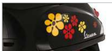
605138M001 "Fiori" rosso/arancio- "Flowers" red/orange

Kit di grafiche adesive per personalizzare Vespa, in tre temi ("Fiori", "Bandiere", "Sport"). Three graphic theme kits (Flowers, Flags, Sport) to customize the Vespa.