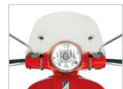
GT/GTS -602953M Cupolino studiato per Vespa GT/GTS realizzato in metacrilato 4mm di alta qualità. Flyscreen in high-quality methacrylate, 4 mm thick, specifically for Vespa GT and GTS.