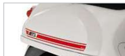
605138M005 "Sport" rosso- "Sport" red