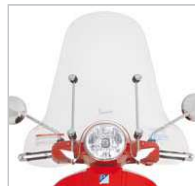
GT/GTS -654451 Parabrezza in metacrilato antiurto e antiscieglia, spessore 4 mm. Inserito nell'omologazione del veicolo. Windscreen in shock-resistant, scratch-resistant methacrylate, 4mm thick. Vehicle-type approved.