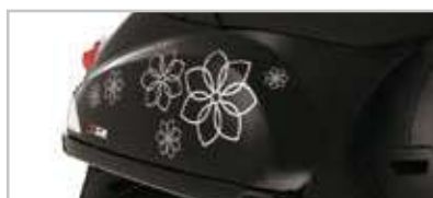
605138M002 "Fiori" silver- "Flowers" silver