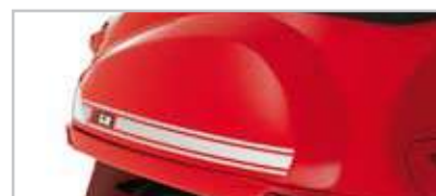
605138M006 "Sport" bianco- "Sport" white