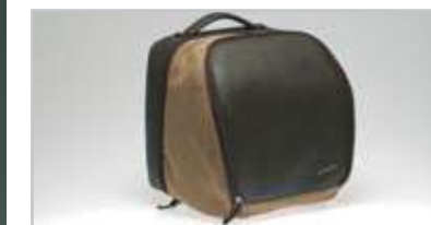
GT/GTS -602927M Borsa interna bauetto GT/GTS realizzata in vera pelle di alta qualità e cotone pesante intrecciato. Vano imbottito per trasporto computer portatile. Colore: marrone/sabbia. Made in Italy. GT/GTS top case inner bag in interwoven high-quality genuine leather and heavy-duty cotton canvas. Padded compartment for a lap top computer. Colour: brown and sand combination. Made in Italy.