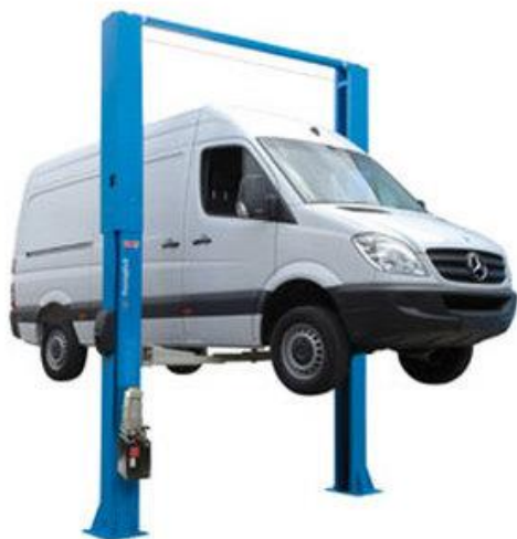
KPH370.42K VAR WIDE + S370A4 KPH370.45KEX VAR WIDE + S370A4