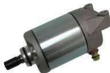
17.4626 motorino 12V - rotazione dx - 9 denti

Rif. Yamaha: 2UJ-81800-03 • 2UJ-81890-00 • 5JX-81890-00