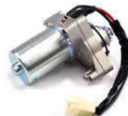
17.81027 motorino 12V - rotazione sx - 12 denti