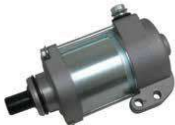
17.81126 motorino 12V/410W - rotazione sx - 9 denti

Rif. Arctic Cat: 0825-001/012 • 3545-012 • 0825-0014 • 3545-024 • 3435-015 Rif. Piaggio: 629874 Rif. Suzuki: 31100-44D21 • 31100-32E01 • 3100-44D10/020 Rif. Mitsuba: SM 13487 • SM 13511