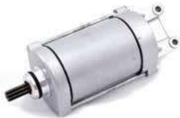
17.81055 motorino 12V - 9 denti - rotazione dx