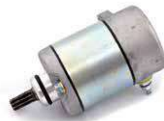
17.81038 motorino 12V - rotazione sx - 9 denti