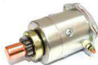
17.81001 motorino 12V - 11 denti - rotazione sx

Rif. Yamaha: 3D6-H1800-00 • 3D6-H1890-00 • 3D9-H1800/01 • 3D9-H1890-00