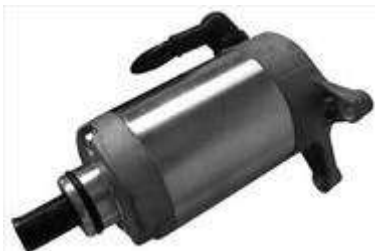
17.4601 motorino 12V - rotazione sx - 9 denti