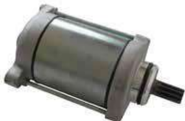
17.81119 motorino 12V - 9 denti - perno corto - rotazione dx

Rif. Arctic Cat: 3545-016 Rif. Piaggio: 629863 Rif. Suzuki: 31100-38F00 Rif. Mitsuba: SM 14241