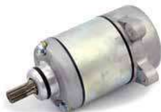
17.81039 motorino 12V - rotazione sx - 9 denti