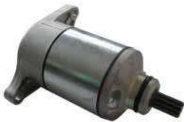
17.81118 motorino 12V - 10 denti - rotazione dx