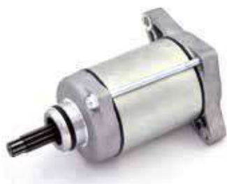
17.81037 motorino 12V - rotazione sx - 9 denti