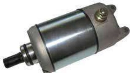
17.4625 motorino 12V - rotazione sx