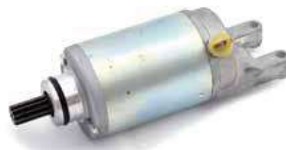
17.81041 motorino 12V - 9 denti - rotazione sx