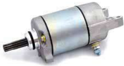
17.81054 motorino 12V - 10 denti - rotazione sx