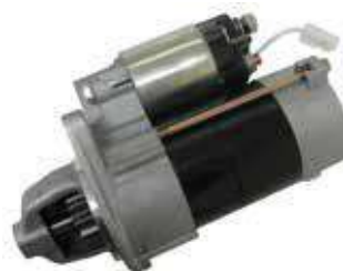
17.81122 motorino 12V/1,0Kw - 9 denti - rotazione dx

Rif. Arctic Cat: 3304-274 Rif. Kymco: 00107045 • 31210-LBA7-900 Rif. Sym: 31200-RB1-000