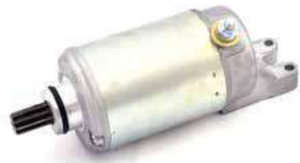
17.81057 motorino 12V - 9 denti - rotazione dx

Rif. orig.: 31200-MN9-003 • 31200-MN9-013