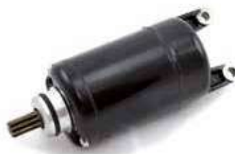
17.81040 motorino 12V - 9 denti - rotazione sx