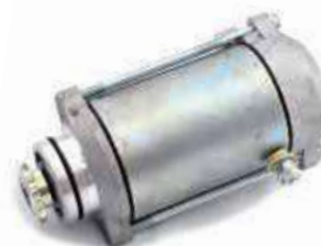
17.81042 motorino 12V - 13 denti - rotazione sx