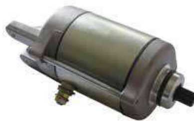
17.81120 motorino 12V - 9 denti - rotazione dx

Rif. orig.: 55140001000 • 55140001100 Equivalente originale Movic Sostituisce 17.81124 Sostituisce Mitsuba SM 16-002