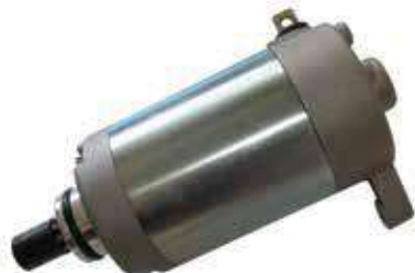
17.4602 motorino 12V - rotazione sx - 9 denti