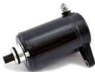
17.81056 motorino 12V - 10 denti - rotazione sx