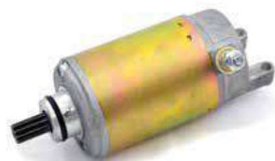
17.81059 motorino 12V