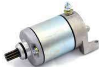
17.81058 motorino 12V - 9 denti - rotazione dx

Rif. orig.: 31200-MCH-831 (31200-MCH-000) • 31200-MCH-A00